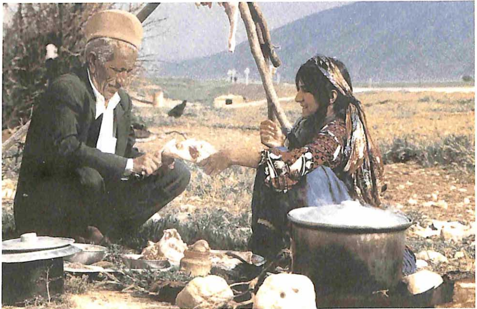
Türk-i kebabin hazırlığı